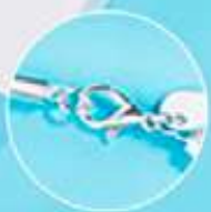
Broche de pinza de langosta

Chapa de Plata .925. Largo collar: 53 cm. 3 meses de garantía.