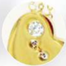
Incrustaciones de zirconia