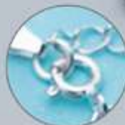
Broche pinza de langosta

Chapa de Plata .925. Largo: 20 cm. 3 meses de garantía.