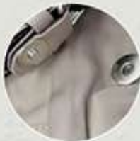
Broches de imán

CUERO PU Y NYLON. 33 cm X 34.5 cm X 18 cm. 3 meses de garantía.