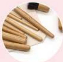
Mangos de madera

Madera y fibras sintéticas. 11.0 cm X 19.0 cm Plus: 11 brochas de diferentes tamaños y grosores.