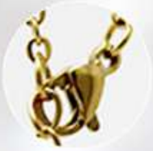
Broche pinza de langosta