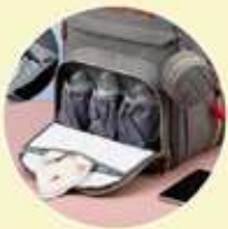
Bolsillo especial para biberones