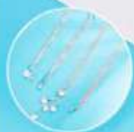
Diseño en 2 piezas