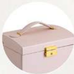
Con asa para fácil traslado