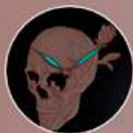
Manecillas que brillan en la oscuridad