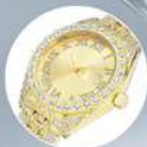
Incrustaciones de zirconias