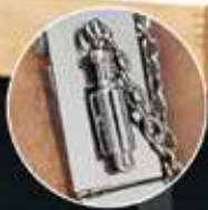
Broche de seguridad