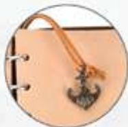
Dije separador de hojas