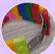
Broche de presión