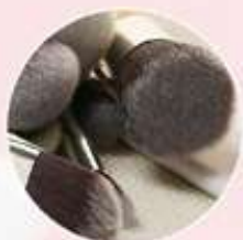
Fibras sintéticas suaves