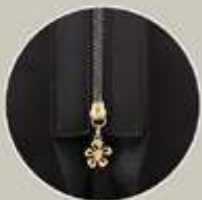
Correa con cierres