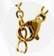
Pinza de langosta