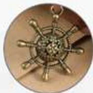
Correa con dije para cerrar