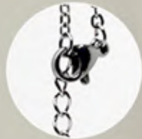
Pinza de langosta

Acero inoxidable. Largo máximo de la cadena: 56 cm. Letras disponibles: R, T, D, I, H. 3 meses de garantía.