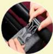
Asas para colgar en la carreola