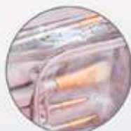
Compartimento para brochas