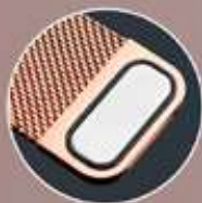
Broche de imán