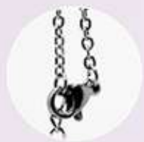
Pinza de langosta