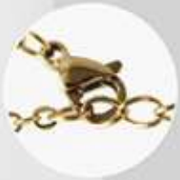
Pinza de langosta