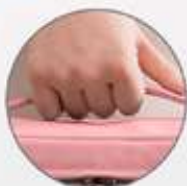
Asa para sujetar