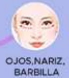
OJOS, NARIZ, BARBILLA

Cuarzo natural. 8.0 cm X 5.5 cm. 3 meses de garantía.