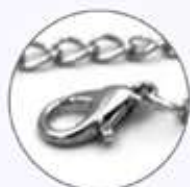
Broche de seguridad ajustable