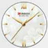
Elegante diseño de carátula