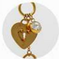
Incrustación de zirconia

Acero Inoxidable. Largo collar: 63 cm. 3 meses de garantía.