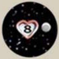
Calendario de corazón