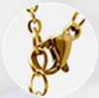
Pinza de langosta