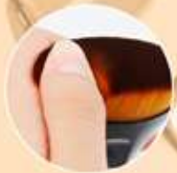
Cerdas suaves y flexibles

Plástico. 4.5 X 3.2 X 3.2 CM. 3 meses de garantía.