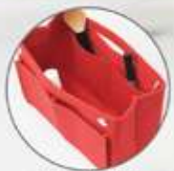
5 bolsillos interiores