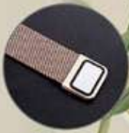
Broche con imán