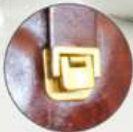
Broche frontal seguro

PU. 21 x 22.5 x 8.5 cm. Largo máximo de la asa: 98 cm. 3 meses de garantía.