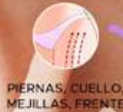
PIERNAS, CUELLO, MEJILLAS, FRENTE