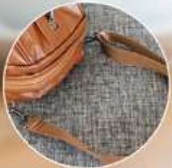
Asa para colgar como bolsa