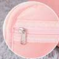
Bolsillo interior de malla