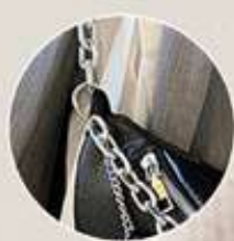
Correa con cadena