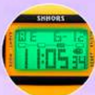
Luz led y alarma