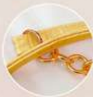
Asa con cadena