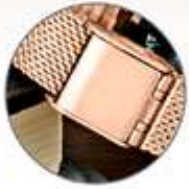
Broche de presión