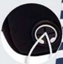
Orificio para audifonos

Nylon impermeable. 22.5 cm x 11.5 cm x 3 cm. Largo max correa: 110cm. 3 meses de garantía.